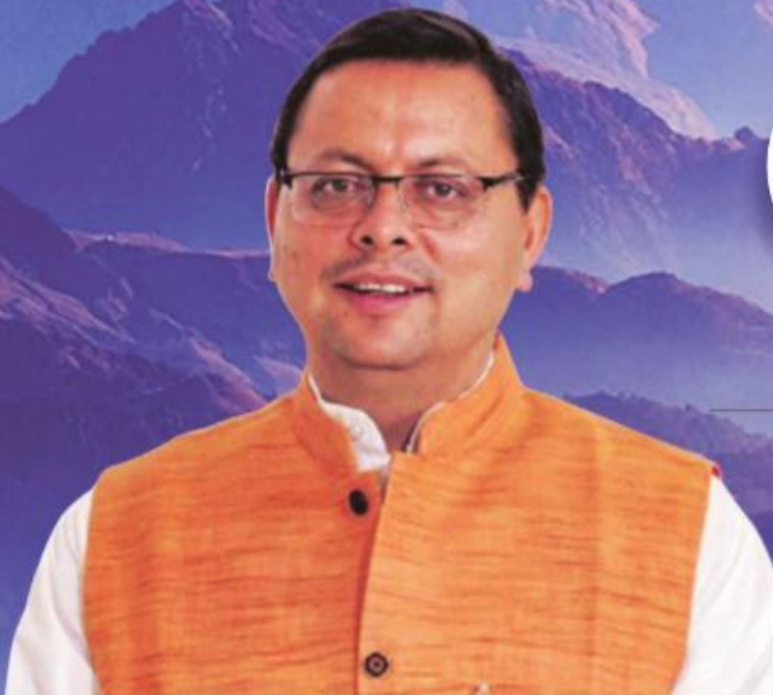
पुष्कर सिंह धामी मुख्यमंत्री