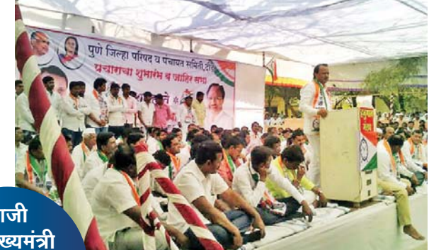
माजी उपमुख्यमंत्री अजित पवार यांचे प्रतिपादन

'देवेंद्र फडणवीस मुख्यमंत्री आहेत, की विरोधी पक्षनेते आहेत हेच कळत नाही. फक्त हात हलवून बेंबीच्या देटापासून बोलतात. त्यांच्या पक्षाची गुंडांच्या पक्ष म्हणून प्रतिमा निर्माण झाली आहे. शिवसेनेने या गुंडांच्या पक्षाचा पाटिंबा काढून घेतल्यास हे सरकार पडेल. त्यावेळी आमचा पक्ष भाजपला पाटिंबा देणार नाही,' असे प्रतिपादन राज्याचे माजी उपमुख्यमंत्री अजित पवार यांनी मंगळवारी केले.